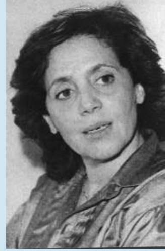
المصدر : رحلات قصيره لبلاد الأساتذة العظام، هباتيا السكندرية بقلم البرت هوبارد 1908

ولدت جميلة بو حيرد في شهر يونيو (حزيران) من عام 1935م في الجزائر التي كانت محتلة في ذلك الوقت، لأسرة من الطبقة المتوسطة، وكان أبوها جزائرياً وأمها تونسية. التحقت جميلة بالمدرسة الفرنسية وانضمت إلى جبهة التحرير الوطنية بينما كانت مازال طالبة. وعملت لاحقاً كضابطة اتصال ومساعدة شخصية لياسف سعدي رئيس المنطقة المستقلة للعاصمة خلال معركة الجزائر.